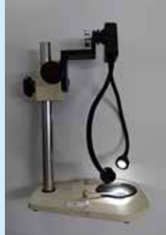
ガラススタンドへの固定