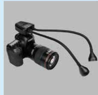
一眼レフカメラへの固定