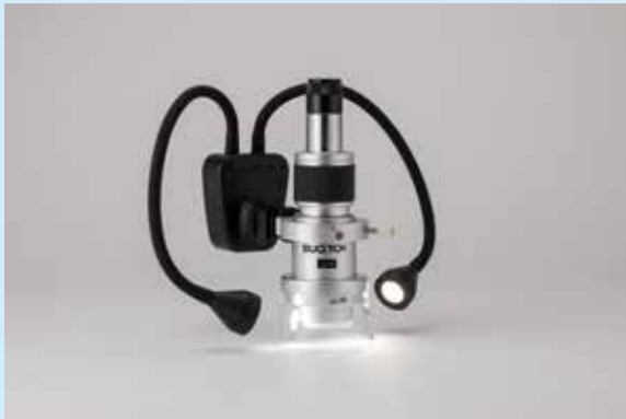
TS-8LEN シリーズ接続利用例